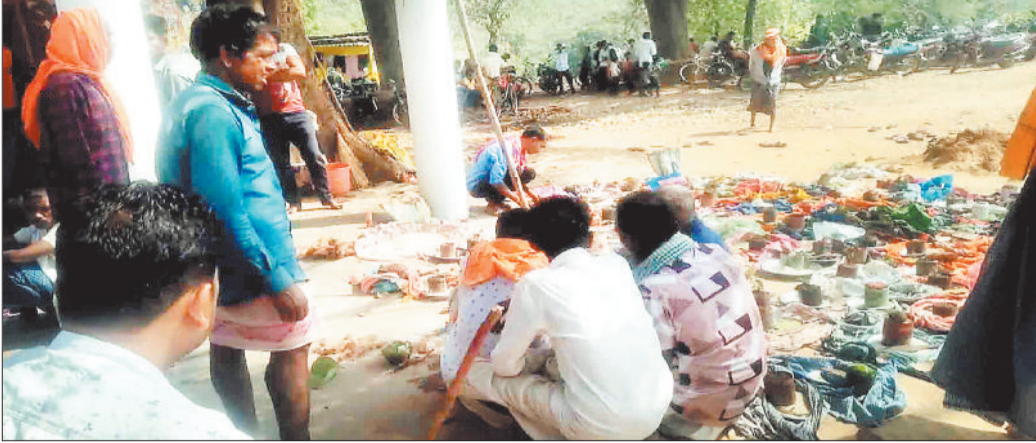
पूजा-अर्चना करते किसान।

सरगुजा जिले में अच्छी बारिश होने और फसल की पैदावार होने की कामना के साथ गांव में रोग, समस्या, दरिद्रता को दूर भगाने के लिए किसान हर साल कठोरी पर्व धूमधाम से मनाते हैं। इस साल भी ग्राम पंचायत कुंवरपुर में शिव मंदिर प्रांगण में कुंवरपुर सहित आसपास गांव के बड़ी संख्या में किसान कठोरी पर्व मनाते एकत्र हुए। किसानों पर पहले मंदिर की 7 बार परिक्रमा की फिर हल चलाकर 5 मुट्टी धान की बुवाई की जिसके बाद किसानों ने कठोरी पर्व धूमधाम से मनाया। इस दौरान ग्रामीणों ने विधि-विधान से पूजा-अर्चना की और अच्छी फसल के लिए पूजा स्थल